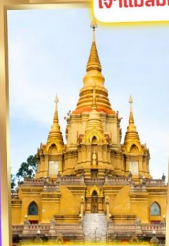
วัดพุทธาธิวาส