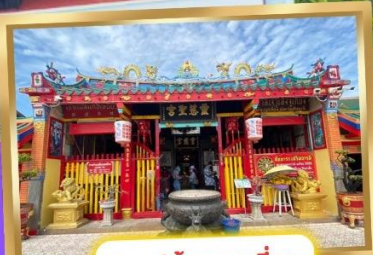
เจ้าแม่ลิ้มกอเหนี่ยว