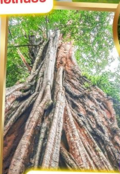
ต้นไม้พันปี